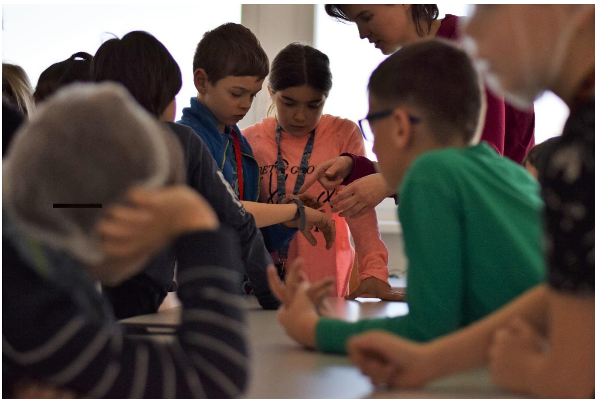
Diagnostikou biosignálů vědci zjistili, zda mají dost sil k prvnímu kroku rozluštění velké záhady.