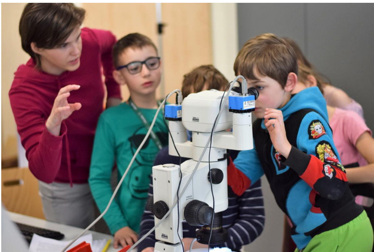
Školním výpočetním tomografem prozkoumali malí vědci obsah meteoritu, ve kterém objevili kostlivce a miniaturním písmem napsaný vzkaz. Pod stereomikroskopem si přečetli kostlivcův vzkaz objasňující důležitost technického vzdělání.